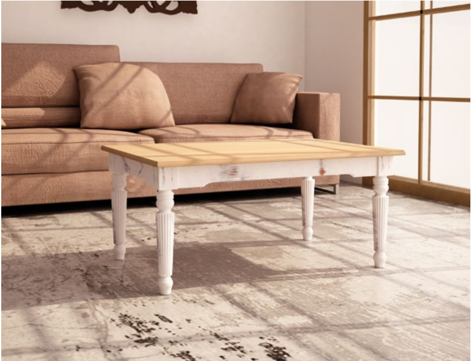
Mesa Centro Clásico Fija Pata Estriada