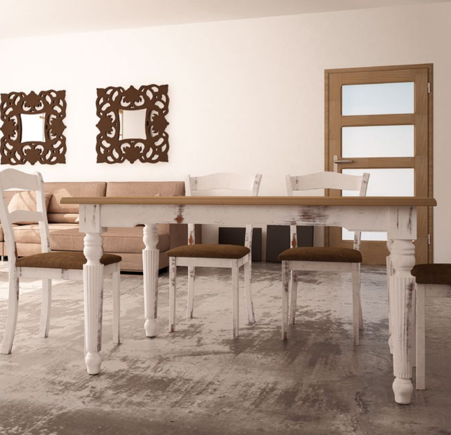
Mesa Comedor Clásico Fija Pata Estriada