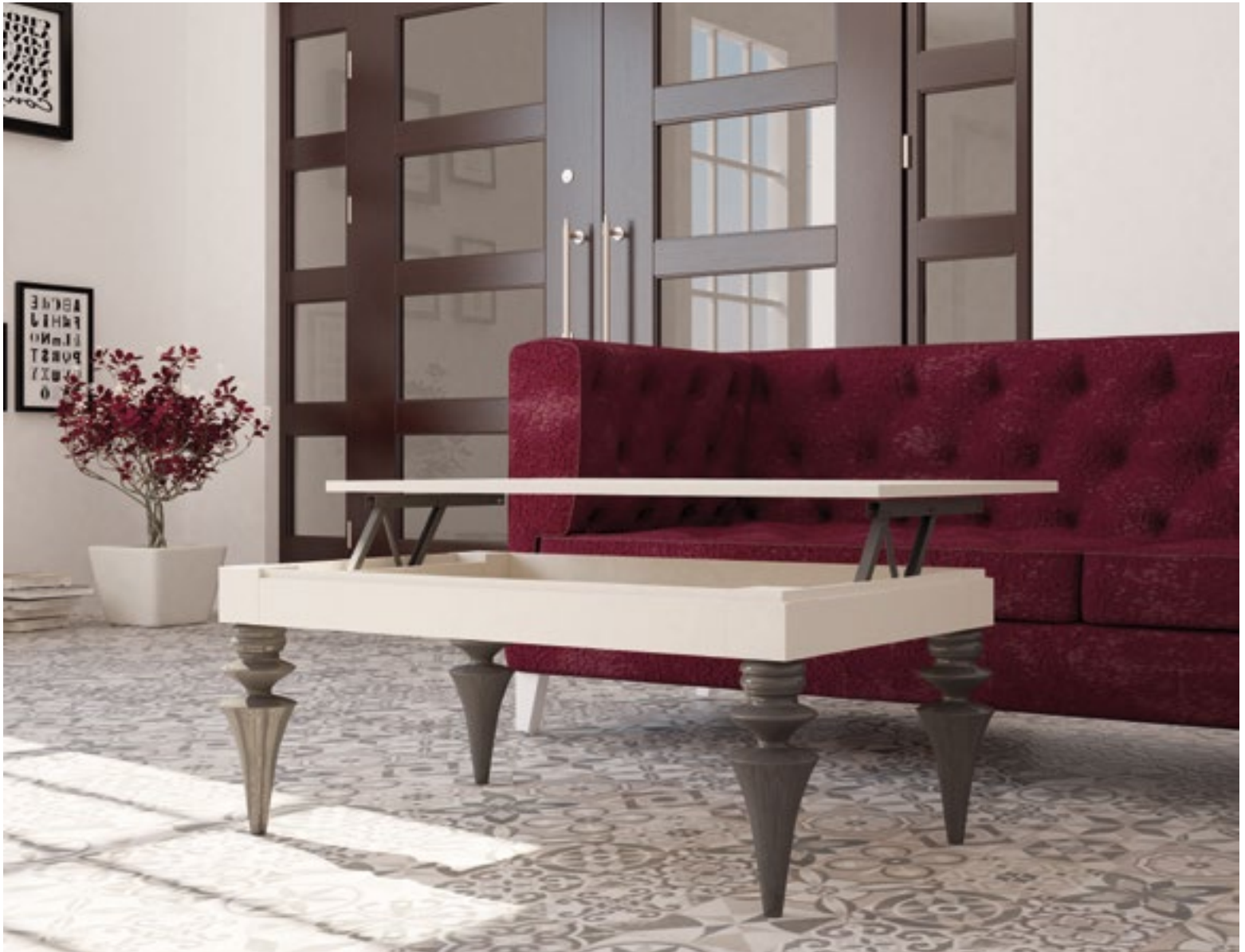
Mesa Centro Venecia Fija