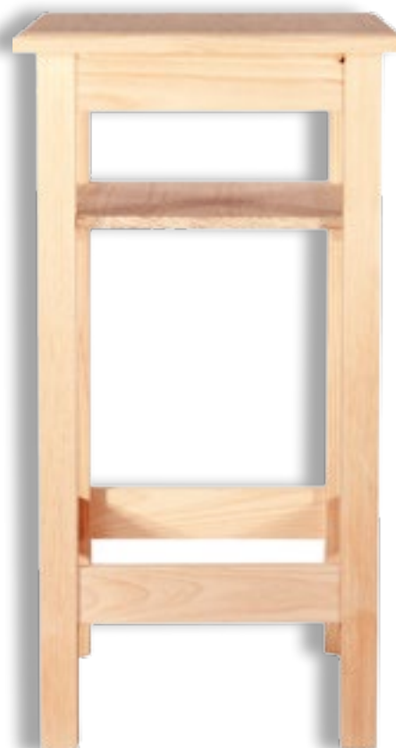
Mesa Alta Bar