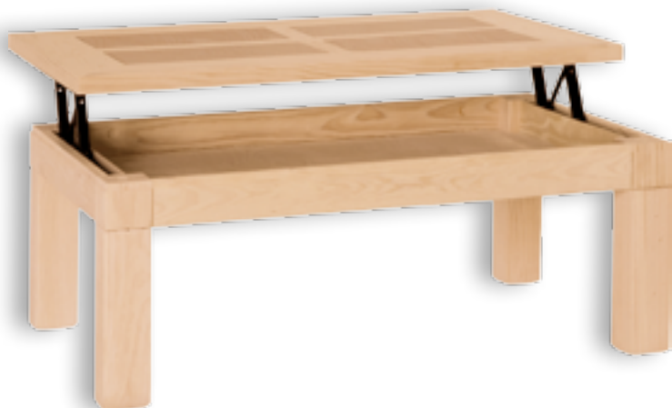
Mesa Centro Mexicana Fija 4 Cuarterones