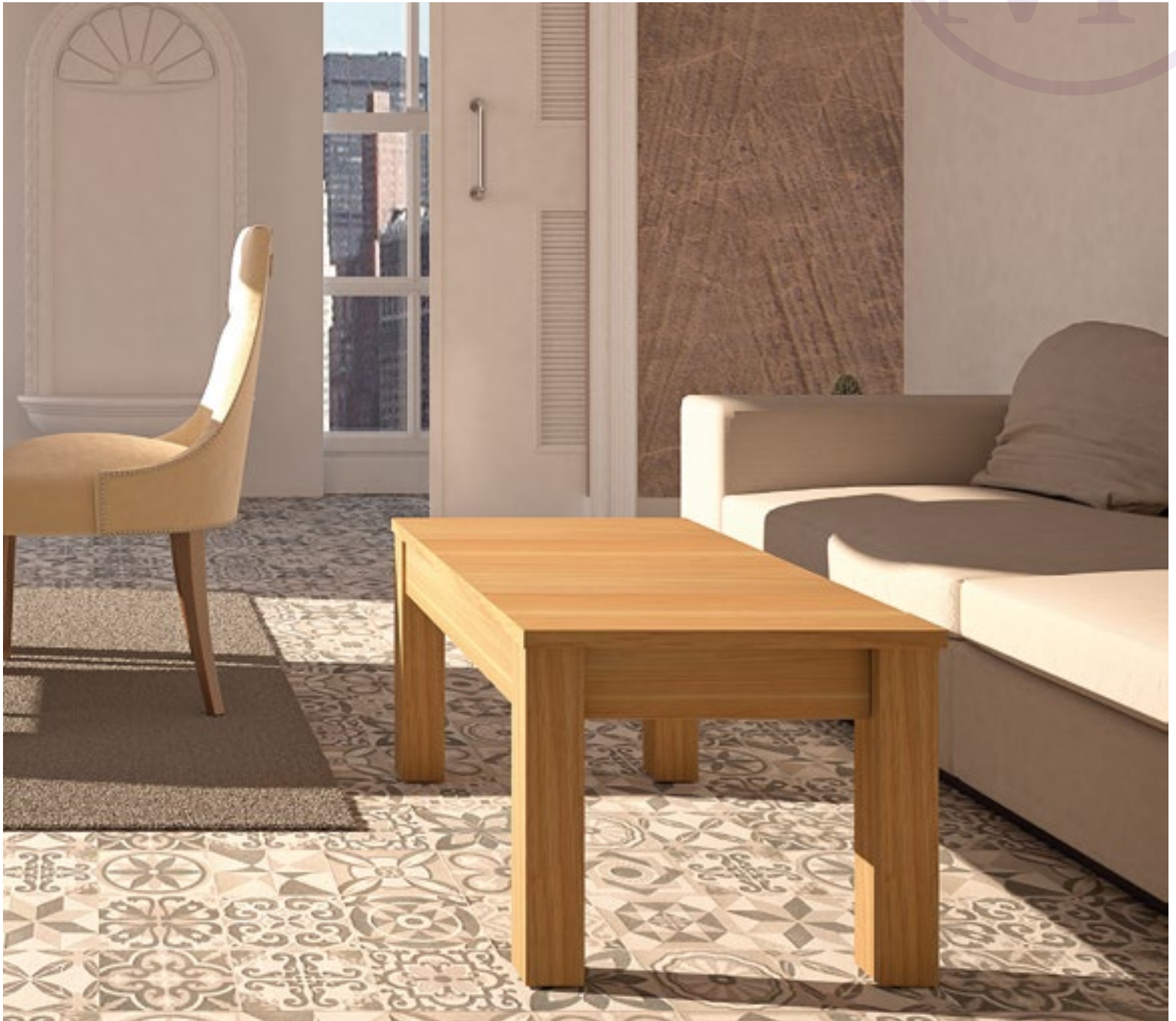
Mesa Centro Florescencia