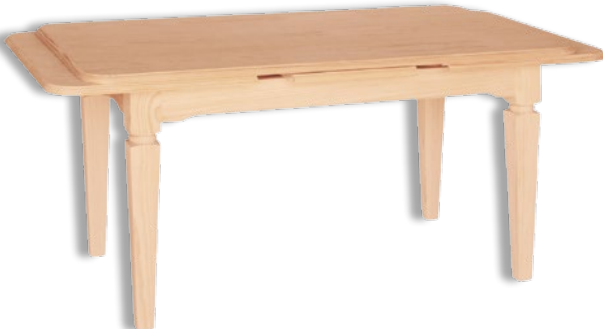
Mesa Rectangular Picos Redondos Pata 10x10