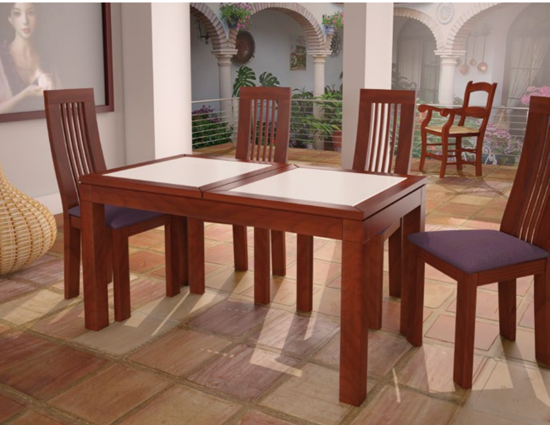
Mesa Comedor Zambra Fija