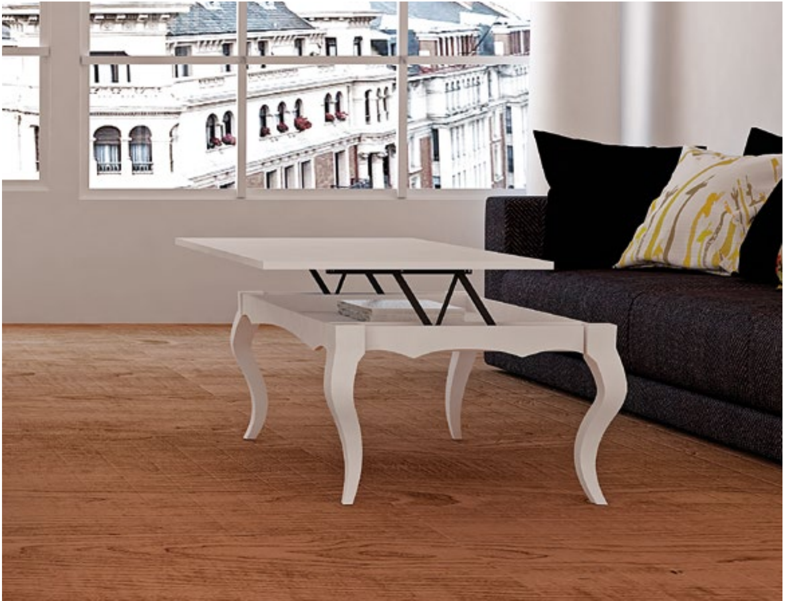
Mesa Centro Napoles Fija