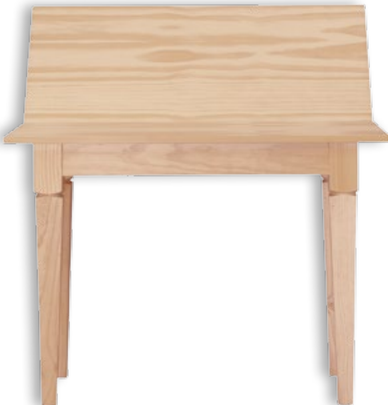
Mesa Cocina Libro