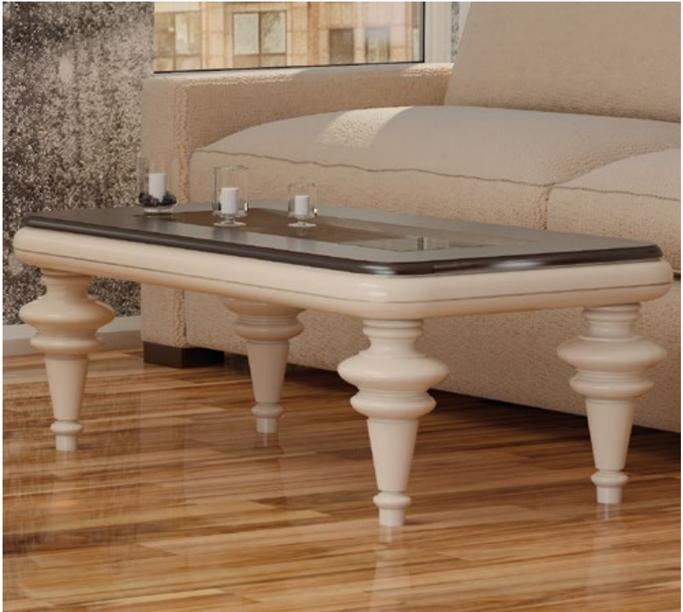
Mesa Centro Valencia Fija