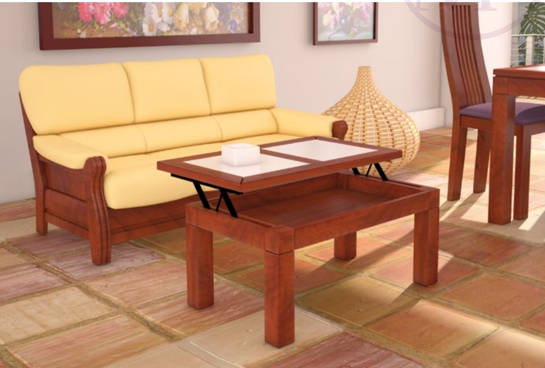
Mesa Centro Zambra