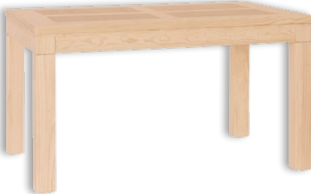
Mesa Comedor Mexicana Fija 4 Cuarterones