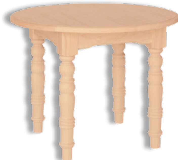
Mesa Redonda Fija Pata 10x10