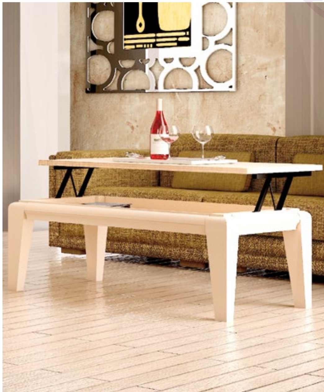
Mesa Centro Azahar Fija