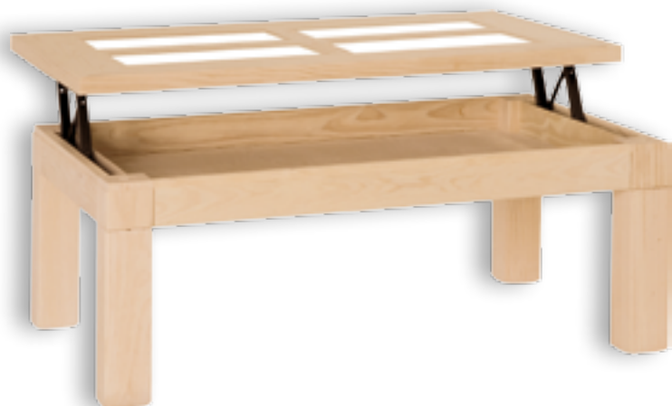
Mesa Centro Mexicana Fija 4 Cristales