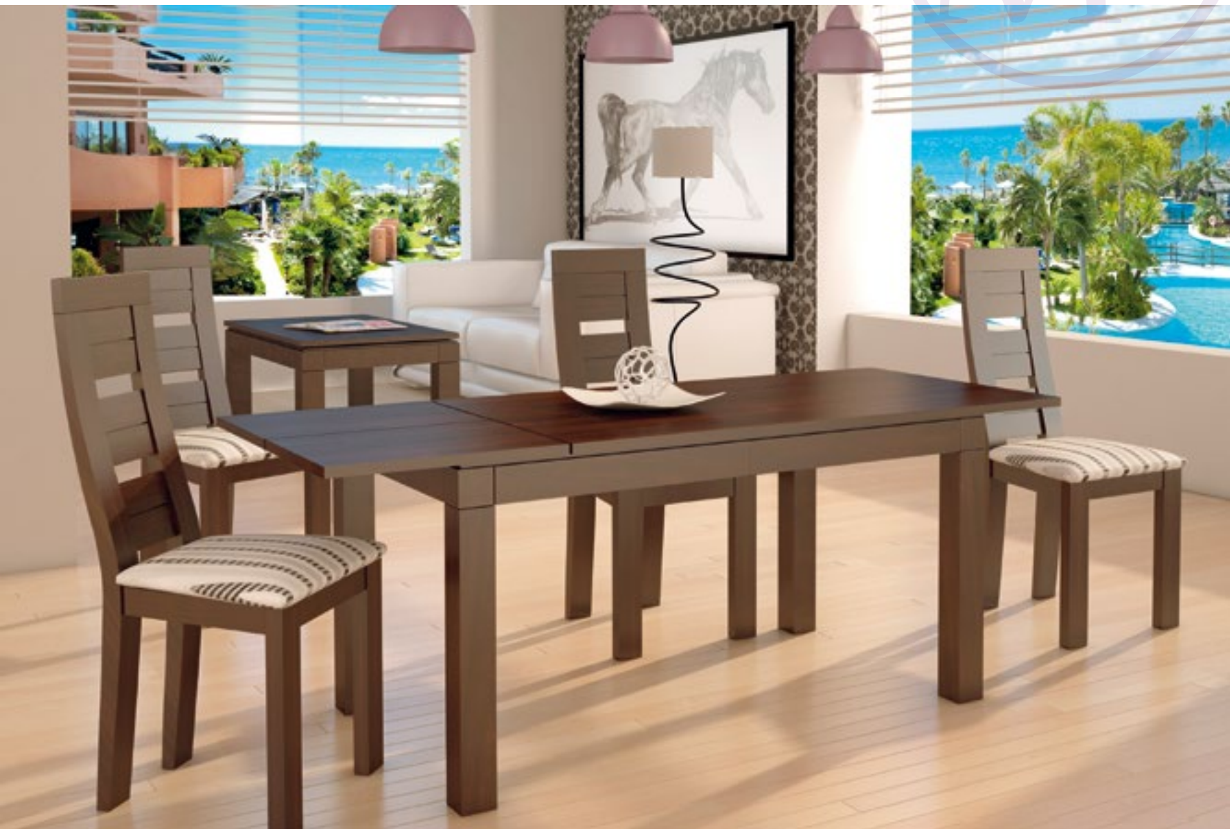
Mesa Comedor Adamuz 26 mm