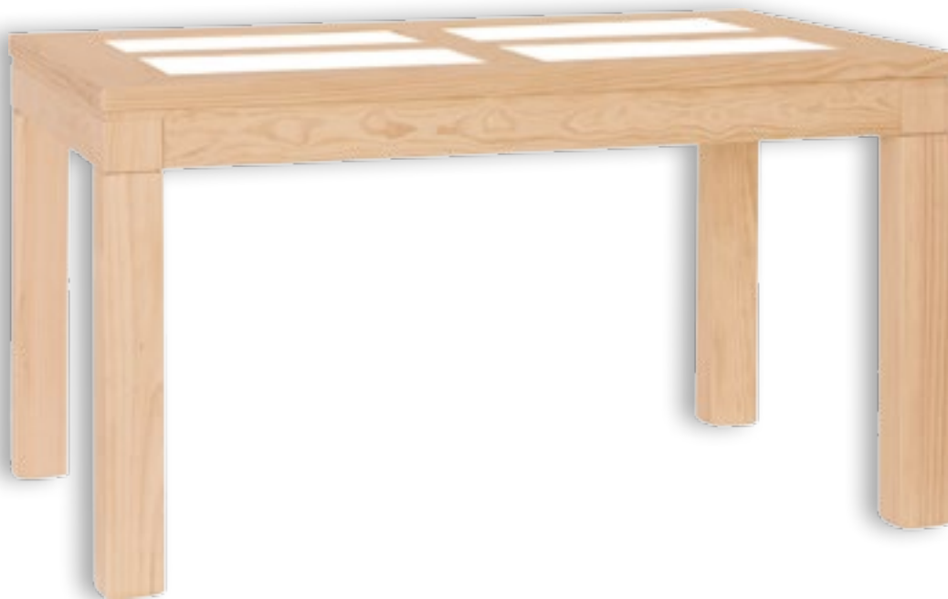
Mesa Comedor Mexicana Fija 4 Cristales