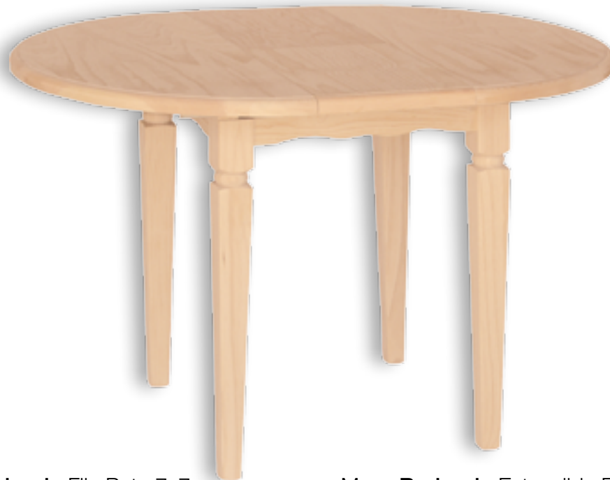
Mesa Redonda Fija Pata 7x7