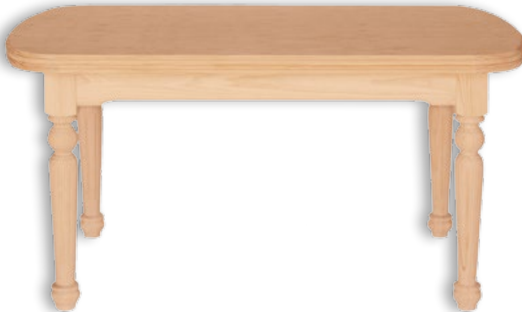
Mesa Petaca Fija Pata 10x10