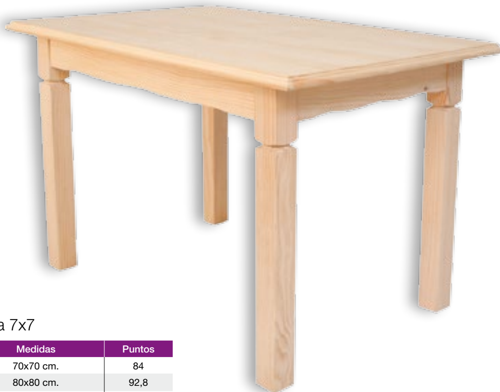
Mesa Bar Pata 7x7