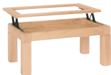
Mesa Centro Madrid Tapa Cristal